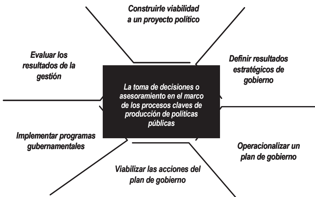
Gráfico 1 Capacidades clave del técnico-político

de gobierno, viabilizar las acciones del plan de gobierno, implementar programas gubernamentales y evaluar los resultados de la gestión (ver Gráfico 1).